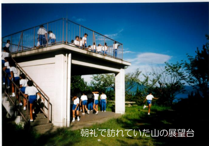
朝礼で訪れていた山の展望台