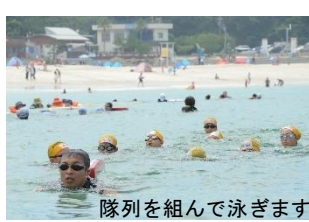
隊列を組んで泳ぎます