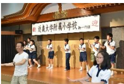
夜の集い。43期生が考えた振り付けで『南の島のハメハメハ』

白浜で行う遠泳も今年で8回目。毎年同じ日程で国立小学校も遠泳を行っており、7月初めの白良浜は小学生でにぎわいます。今年は梅雨入りが遅かったこともあり、気温・水温共に冷たく、子供たちはふるえながら海で泳ぎました。遠泳当日も朝から雨。雨雲がぬけるのを待って実施した遠泳は60分間。90分泳ぎたかった、