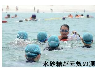
水砂糖が元気の源