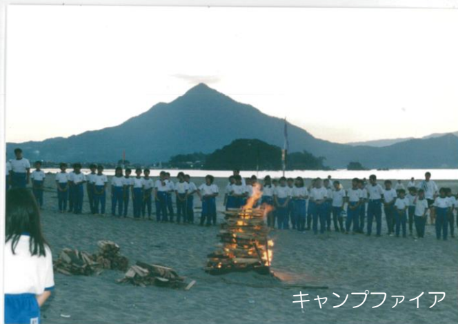
キャンプファイア